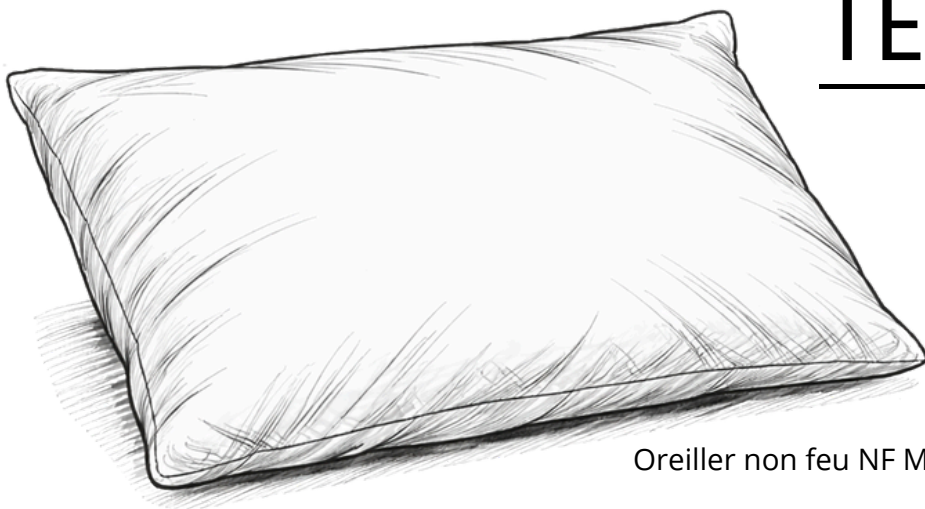
Oreiller non feu NF M1.

Confection : piqûre 5 fils intérieure et double piqûre à la fermeture.