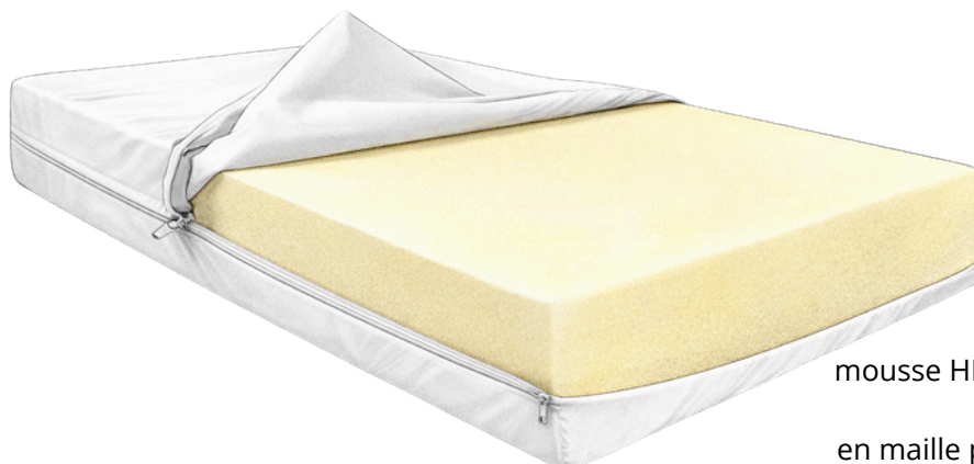
Matelas enfant M1 (60 x 120 x 10 cm).

mousse HR 35 pour un soutien ferme et équilibré. Recouvert d'une housse en maille polyester enduite en polyuréthane blanc traitement antibactérien. Housse non feu M1.